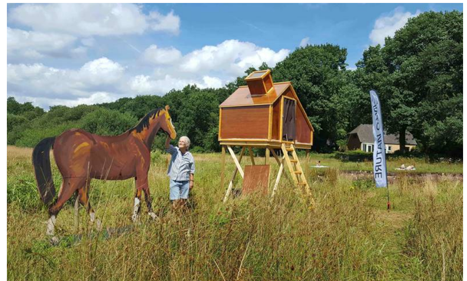
Wietske Jonker bij het 'mysterieuze' paard

Ik heb het beest overeind gezet, getroost en daarna voorzichtig weer in het hoge gras neer gevleid.